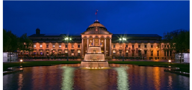
Kurhaus Wiesbaden

Am Nachmittag treffen Sie sich mit Ihrer örtlichen Reiseleitung in der Hotellobby zu einem gemeinsamen Stadtrundgang durch Hessens Landeshauptstadt. Dabei sehen Sie unter anderem die neugotische Marktkirche , ein imposanter Backsteinbau aus der Mitte des 19. Jh.s von Carl Boos. Am Bowling Green , einer großen Grünanlage mit zwei prächtigen Kaskadenbrunnen, liegt das Hessische Staatstheater als Mittelpunkt der Theaterkolonnaden. Ihm gegenüber auf der anderen Seite des Bowling Green liegen die