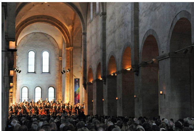
Basilika Kloster Eberbach

Nach dem Rundgang erwartet Sie die Klosterküche in dem stilvoll ausgebauten „Heuboden“ zu einem schmackhaften gemeinsamen Abendessen.