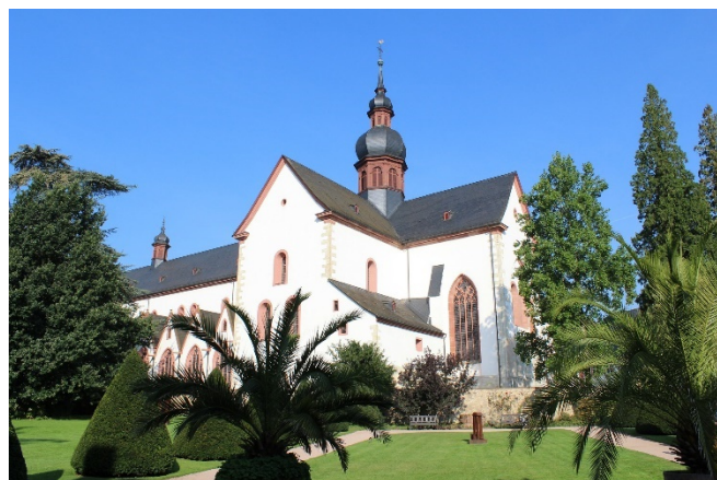
Kloster Eberbach

Am Nachmittag besuchen Sie Kloster Eberbach. Die ehemalige Zisterzienserabtei wurde im Jahr 1136 von Bernhard von Clairvaux gegründet und diente als Kulisse für die Verfilmung des Romans „ Der Name der Rose “ mit Sean Connery.