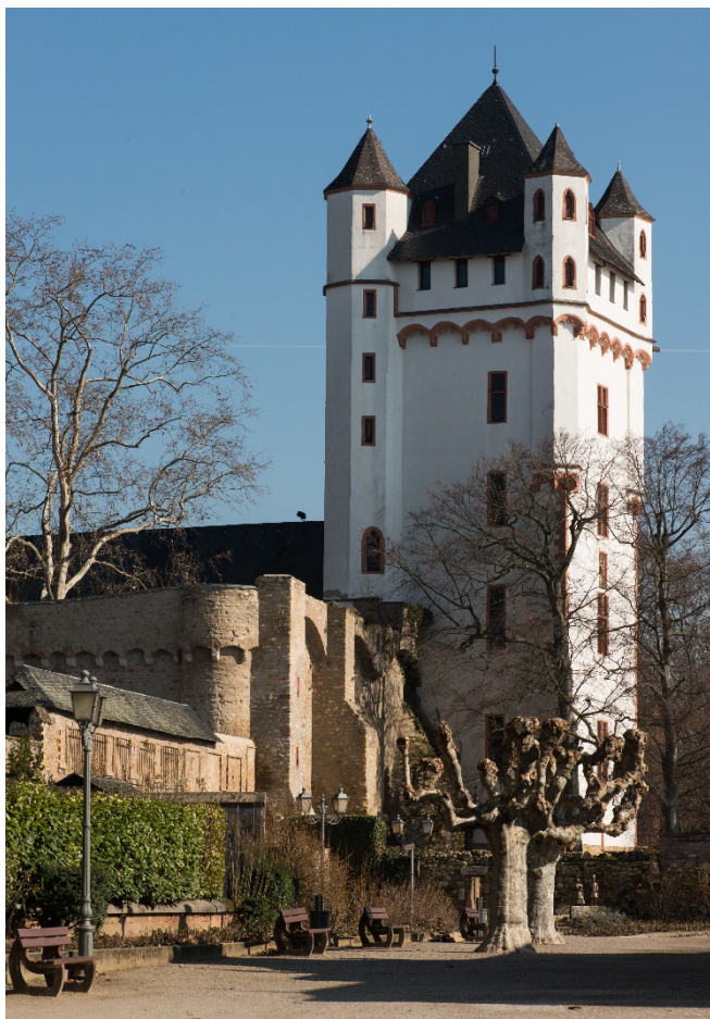
Kurfürstliche Burg in Eltville

Mit dem Gustav Mahler Jugendorchester unter der Leitung von Ingo Metzmaker wird der Abend zu einem unvergesslichen Klangerlebnis. Die Leidenschaft der jugendlichen Musiker und das heutige klangvolle Programm bilden einen würdigen Abschluss des Musik-Festivals.